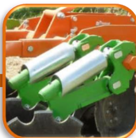
●ストーンジャンパー ディスクに障害物が当たると スプリングにより持ち上がり ショックを吸収します。スプリ ングはディスクにバイブレーション 効果ももたらし土塊を砕きます。