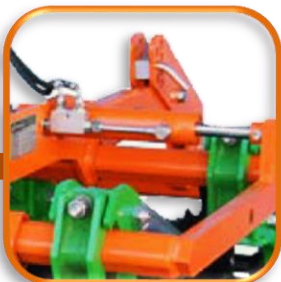
●油圧伸縮フレーム 作業幅を油圧で調整できます (伸縮幅35cm)