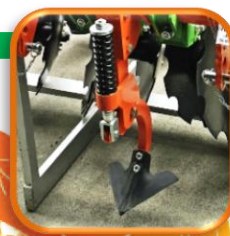
●スプリング付きセンターシャック