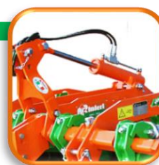
●油圧リフトシリンダー 本体を垂直リフトさせる事で 狭い場所での転回時にトラクター の旋回性が向上します。

このカタログの外観及び仕様は改良などにより予告無く変更される場合があります。(19.08.01)