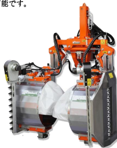
※写真はOPのフロントカッターバー装着機です

TOWER-2フレームに2つのDRFヘッドを装着できます。同じ列の両側で同時作業が可能です。