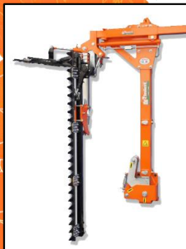
TOWER 1 L型