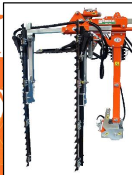
TOWER 1 U型